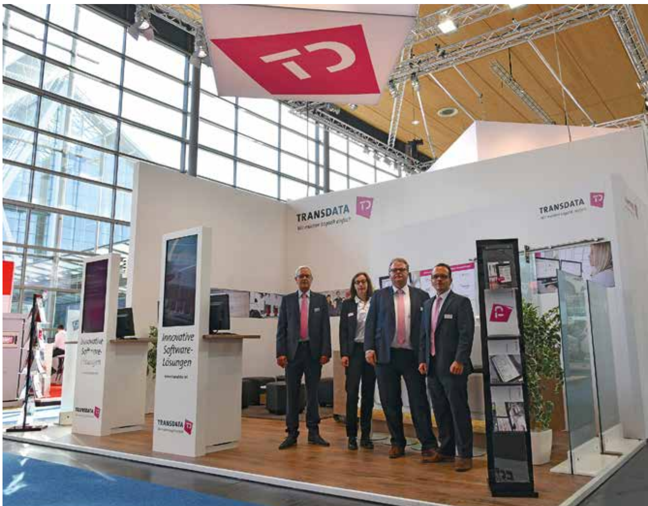
Premierenstimmung auf der IAA: Das TRANSDATA-Team stellte in Hannover erstmals die automatisierte Tourenplanung und -optimierung vor.

Verschiedenste Einflussfaktoren wie Volumen, Gewicht, Zeitfenster für die Auslieferung sowie die maximale Tourdauer